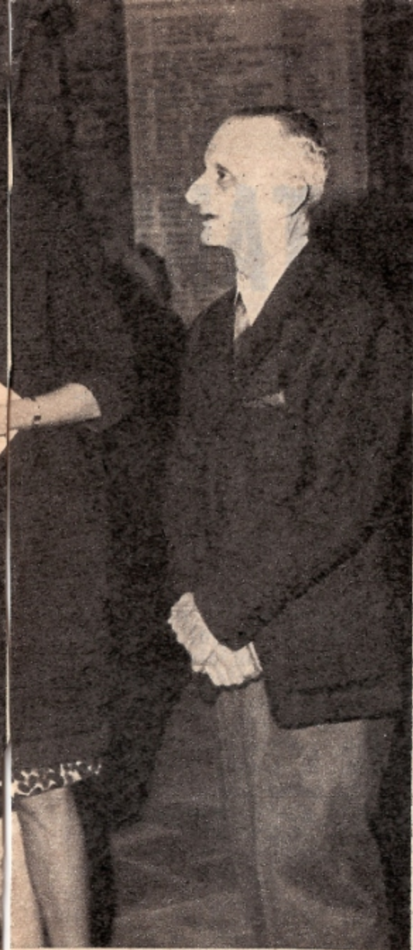
del Seicento offerta al Nella fotografia sotto: visitatrice sorride a seguito la sua visita.