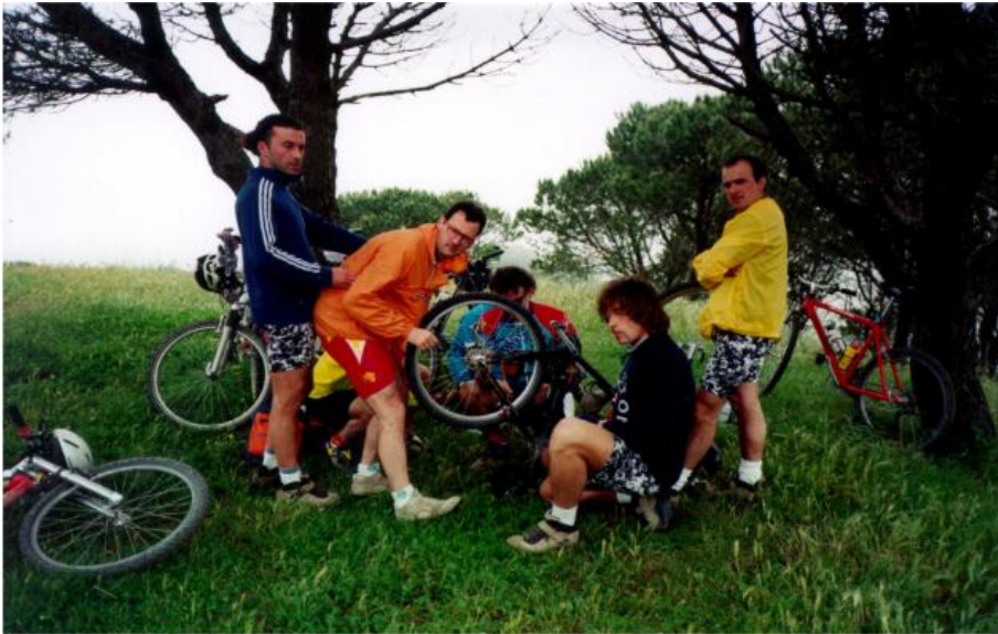
Foto 01 - Il nostro meccanico amanuense

Il gruppo in questo tour è diventato più numeroso: siamo a 16 unità e senza dubbio ci siamo divertiti "alla grande"; quella dell'Hotel è stata una scelta azzeccata e poi la piscina è