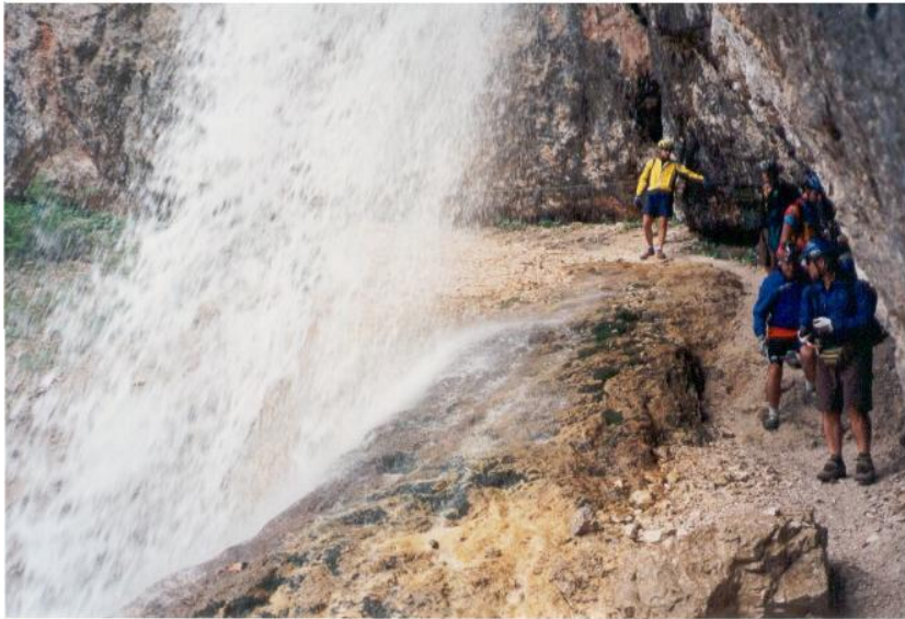
Foto 03 - Cascata spettacolare

al rifugio Fanes (vedi foto n° 02) che è stata davvero dura anche se il fondo era un biliardo. Il paesaggio in questa valle è davvero bello e la vista del rifugio ha levato