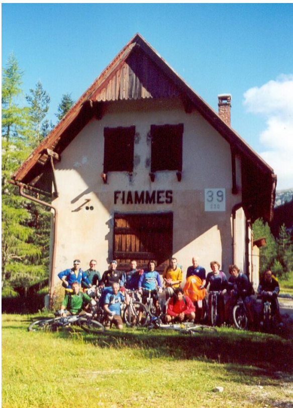
Foto 04 - La Stazione di Fiammes

tutti sanno, quando la glicemia scende gioca brutti scherzi. Poi altro colpo di temporale con un poco di grandine, ed allora tutti dentro al rifugio per continuare