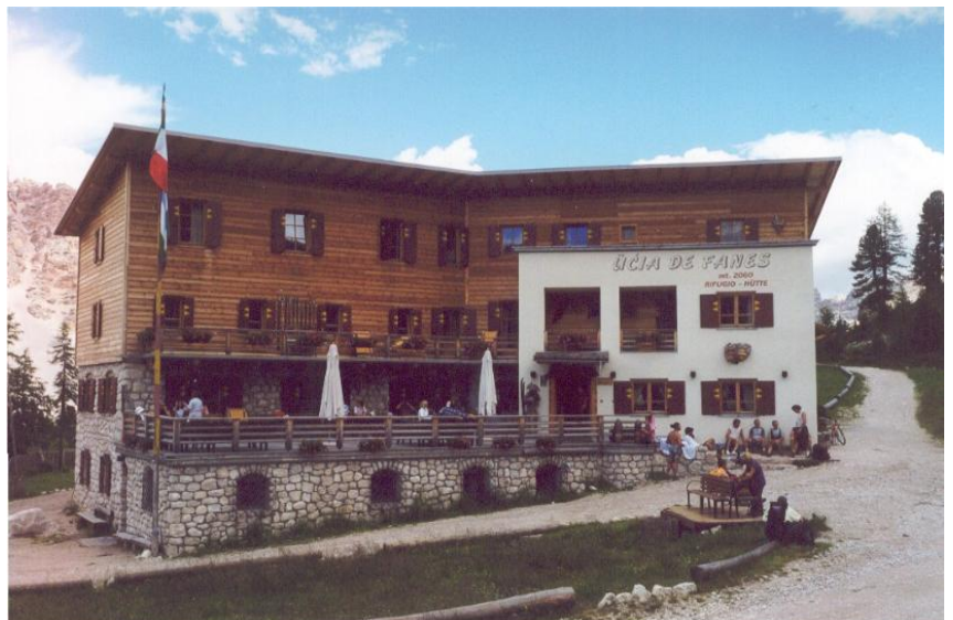
Foto 02 - Il Rifugio Fanes

quali sono le strade ed i sentieri percorribili. All'hotel l'aperitivo è d'obbligo e l'incontro con tutti gli altri bikers del gruppo è stato come al solito piacevole. Il temporale, che tra l'altro è durato tutta la notte,