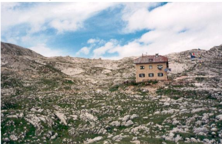
Foto 08 - Il Rifugio Biella