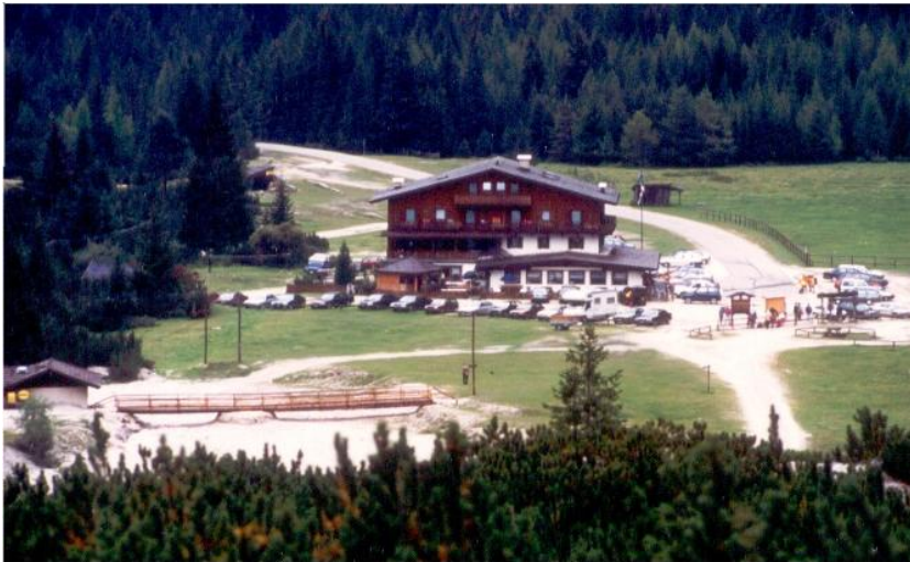
Foto 01 - Il Rifugio Pederù

Siamo sulla autostrada verso la Val Pusteria e dopo lunghissimi chilometri ci ritroviamo in una bella giornata di sole a San Vigilio di Marebbe, piccolo paesino