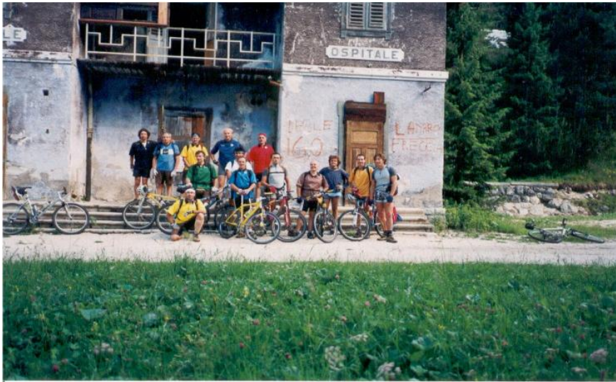
Foto 05 - La Stazione di Ospitale

Proseguiamo verso Fiammes con degli amici di Parma dove ci aspetta la doccia, non prima di osservare una piccolo percorso di rally, se così si poteva chiamare!! Manco