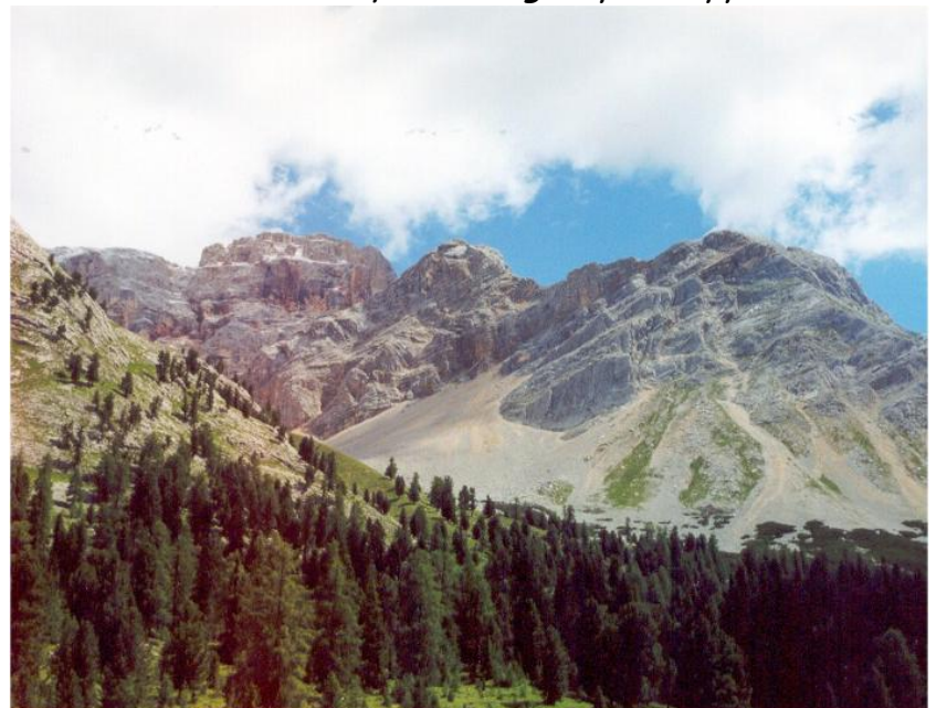
Foto 06 - La Croda Rossa

sogno e credo non si potrà più recuperare una tratto che ancora oggi sarebbe molto frequentato. Passiamo la galleria, sempre quasi in piano, e lo spettacolare ponte in ferro. Arriviamo al nostro sentiero verso la Forcella Lerosa dove lasciamo un