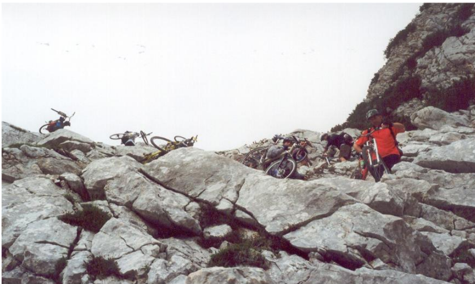
Foto 19 - Il brivido della ferrata

la Forcella Sora Forno (vedi foto n° 18) punto più alto del tour (2388 m). Da qui si scende bruscamente seguendo il segnavia della'Alta Via delle Dolomiti e sentiero