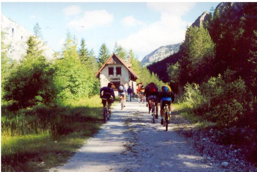
Foto 14 - Fiammes, stazione di Fiammes

Si riparte per la seconda tappa da Fiames (1296 m), percorrendo la statale d'Alemagna in direzione Cortina D'Ampezzo e proprio all'altezza del Camping Olimpia deviamo sulla stradina