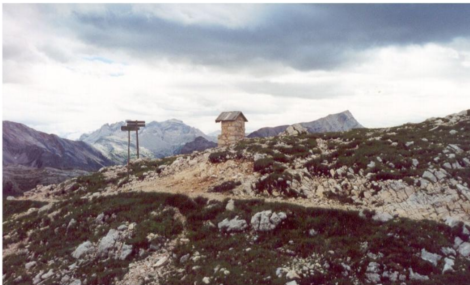
Foto 18 - La Forcella Sora Forno, punto più alto del Tour

L'inizio della seconda tappa è incantevole ed il risveglio al rif. Biella (2327 m) offre un panorama stupendo. Presi i nostri mezzi ci dirigiamo, in un tratto di salita a