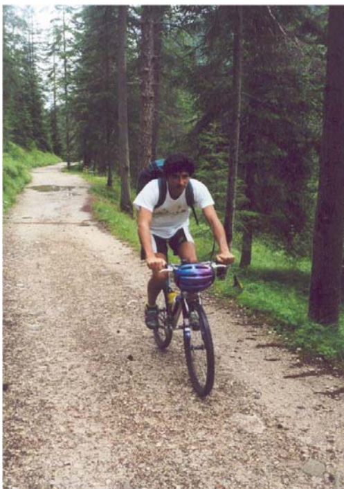
Foto 10 - La carrereccia verso Pederù

Questo grandioso itinerario è interessante sia dal punto di vista ambientale che da quello più squisitamente ciclistico. Il punti più significativi sono rappresentati dall'Alpe di Fànes, situato nel territorio tutelato dall'omonimo Parco naturale, istituito nel 1980 dalla Provincia Autonoma di Bolzano. Dopo aver fatto il pieno con una colazione abbondante si parte per la prima tappa del tour da San Vigilio di Marebbe (1193 m) dove, attraversando la piazza con la