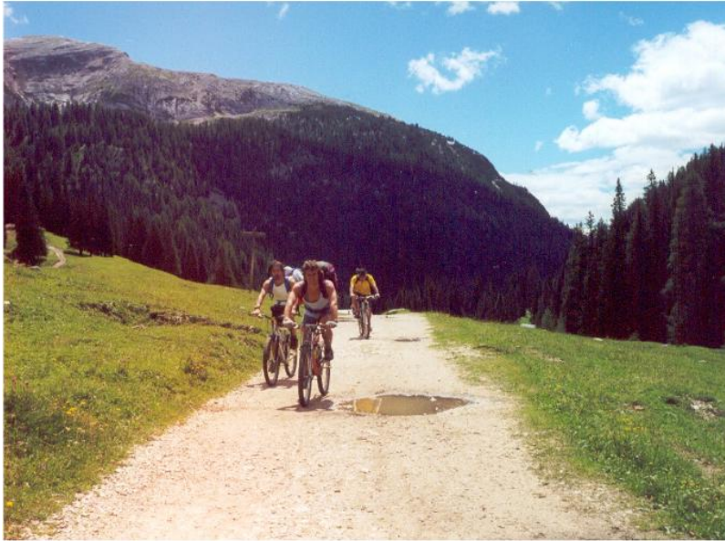
Foto 16 - La carrareccia dopo il Rif. Ra Stua

mulattiera per "Val de Gotres - Lerosa - Ra Stua n° "8" (1512 m) passando la stanga. Dopo un primo chilometro tranquillo, la mulattiera s'inerpica nel bosco su ripide coste, con qualche tratto cosparso di ghiaia ed al limite della pedalabilità. Andiamo ad affiancare le limpide acque del torrente Gotres dove superiamo una seconda stanga, dovendo quindi scendere dalla bici per qualche decina di metri.