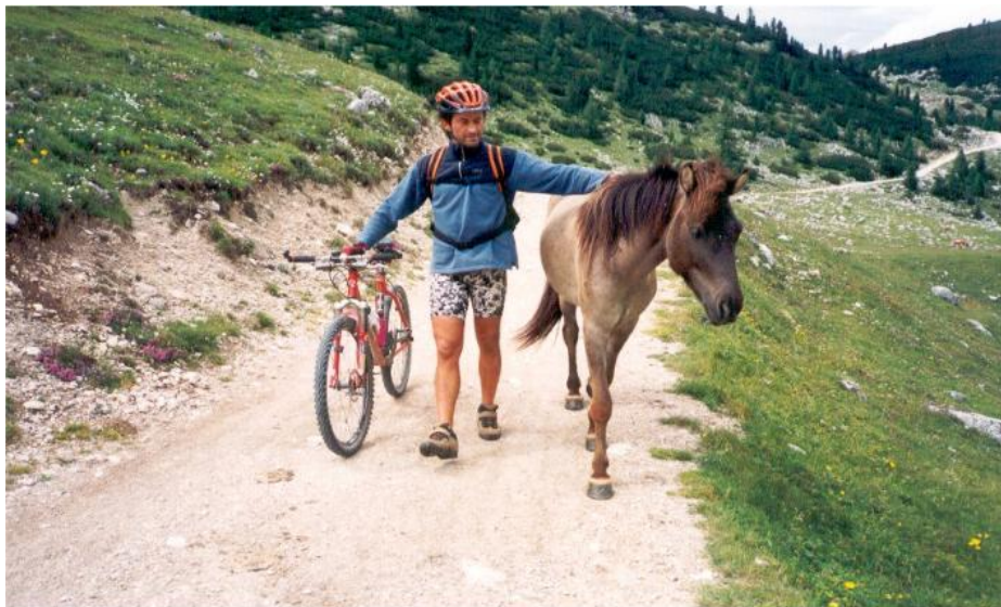
Foto 11 - Un piacevole incontro

indicazione una bandierina bianco-rossa, che ci accompagnerà fino al Rifugio Pederù. La mulattiera, arrivati in prossimità di un zona prativa più aperta, diventerà sentiero dove le radici degli alberi rendono il nostro percorso più impegnativo e