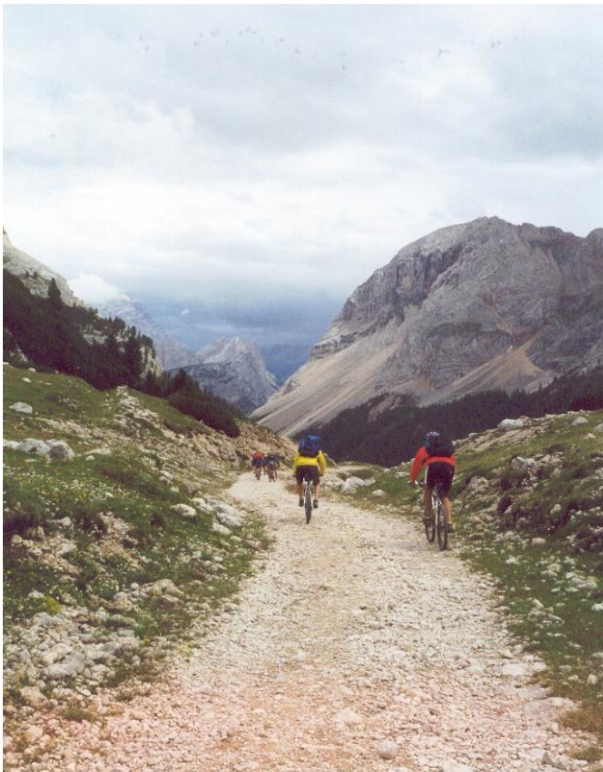
Foto 13 - La bella discesa in Val Fanes

guadagnare la piana dove, a sinistra, è situato il minuscolo lago Piciodèl. Successivamente andiamo ad affrontare un secondo salto che porta, dopo un tratto scorbutico, sull'Alpe di Fanes. Fresche acque, verdi pascoli, rocce scintillanti piante secolari, riempiono la vista e fanno dimenticare lo sforzo. Ad un bivio teniamo la sx (segnavia "10" & "11" per giungere dopo un'ultima rampa al rif. Fanes (2060 m) che, insieme al vicino rif. Lavarella (all'ultimo bivio a dx), costituisce il principale punto d'appoggio per le escursioni in zona. Una visita al rifugio da poco restaurato è d'obbligo anche per fare il pieno alle nostre borracce, per poter affrontare l'ultima asperità del giro con un chilometro di salita alquanto impegnativa e malagevole (segnavia n° 10) . Il piacere della vista che si apre sul magnifico altopiano accompagna un ultimo tratto davvero difficile, ma il Passo del Limo (2172 m) è molto vicino preannunciando una discesa lunga quanto entusiasmante nella valle di Fanes. Superiamo il vicino Lago di Limo sulla nostra sinistra dove la nostra discesa si fa più veloce, ed un primo brusco abbassamento conduce alla malga di Fanes Grande (2102 m) dove si tiene la sinistra seguendo il fondo della valle (vedi foto n°