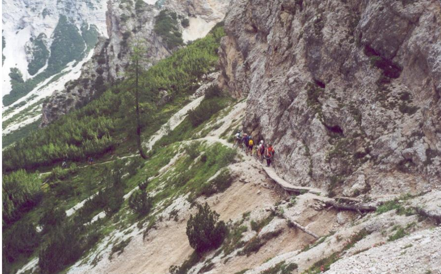
Foto 21 - Un passaggio da brivido

risalendo sempre con il nostro segnavia "1"; un secondo salto roccioso per arrivare ad una larga conca che porta al bellissimo Lago di Braies. Il sentiero, dopo alcuni tonnati e passato un ponticello in legno attrezzato con catena (vedi foto n° 21) in un