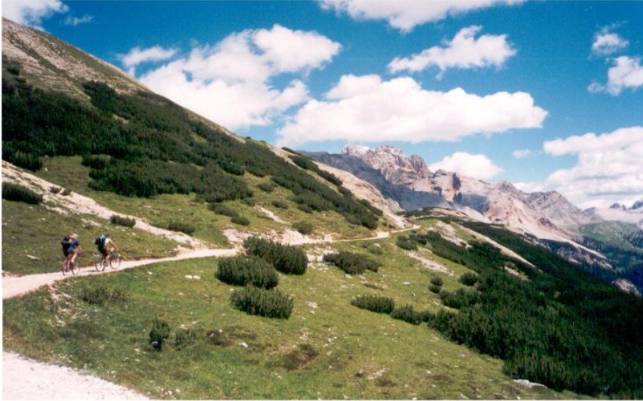
Foto 17 - Passato il bivio per il Rif. Biella

costretti a smontare e camminare per alcune centinaia di metri in corrispondenza di alcuni tornanti. Potremo riprendere a pedalare più agevolmente per oltrepassare una