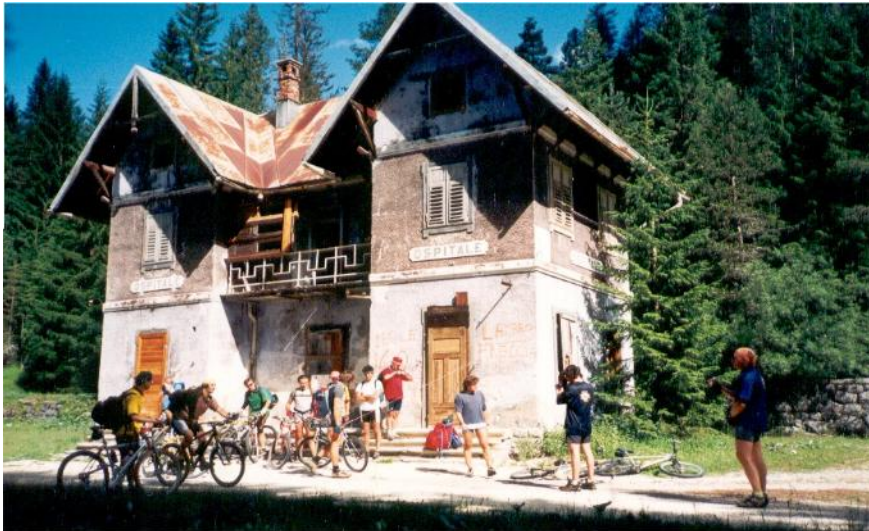
Foto 15 - Ospitale, stazione di Ospitale

di sinistra, incrociando a breve una larga carrareccia, raggiungendo l'ex ferrovia Dobbiaco Cortina, facilmente identificabile per la sua modesta pendenza. Passiamo